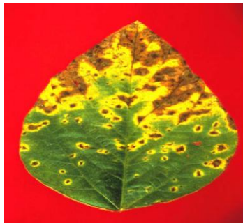
ምስል1.ብራውን ስፖት የተጠቃ የአከራ አተር ቅጠል