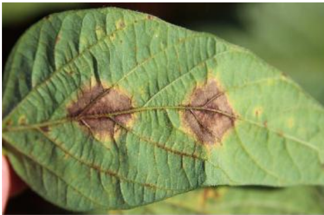
ምስል 2. ሊፍ ብሎች የተጠቃ የአኩሪ አተር ቅጠል