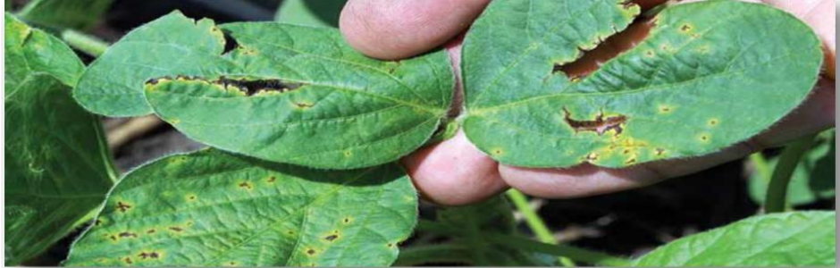
ምስል4. በባክቴሪያል ብላይት የአኩሪ ኦተር ቅጠል