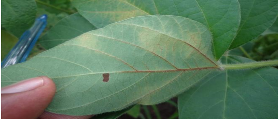
ምስል5. በአንት-ራክኖስየአኩሪ አተር ቅጠል