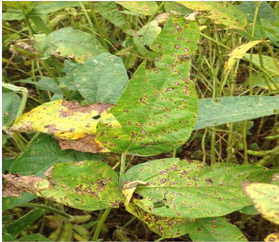
ምስል3 በፍሮግ አይ ሊፍ ስፖት-የተጠቃ የአኩሪ አተር ቅጠል