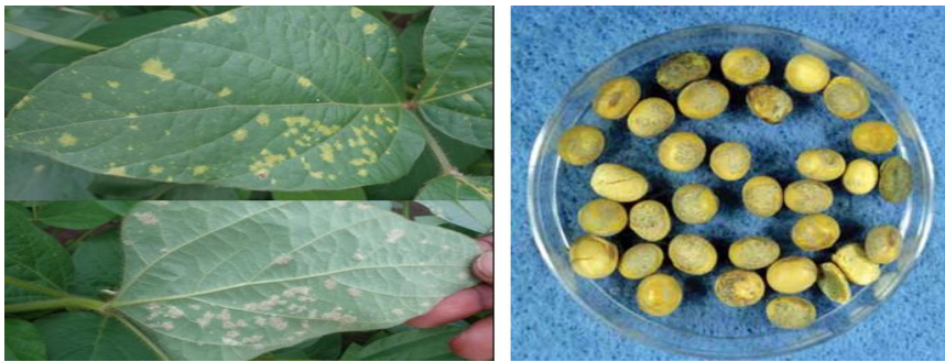
ምስል 6. በዳውኒ ሚልዲው የተጠቃ የአኩሪ አተር